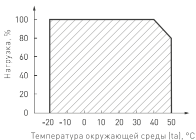
Рис. 2. Максимальная допустимая нагрузка, % от мощности источника.